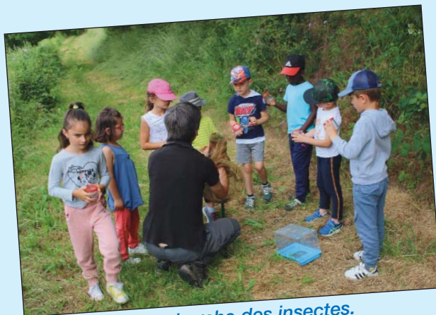
A la recherche des insectes.