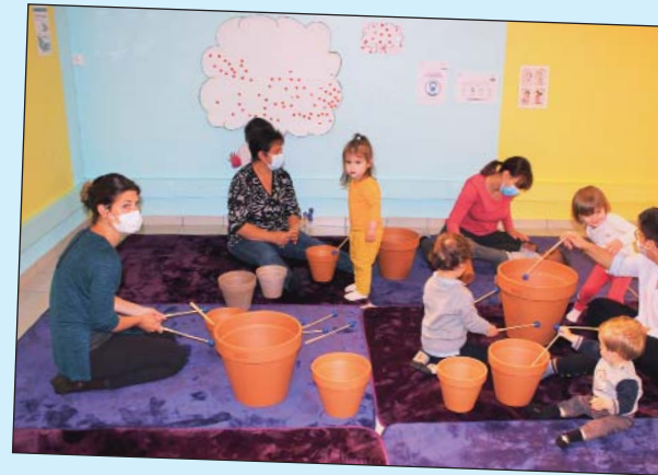
Des percussions au RPE.