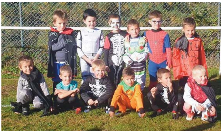
Les U6-U7 pour l'entraînement Halloween.

Pour tous renseignements, vous pouvez contacter