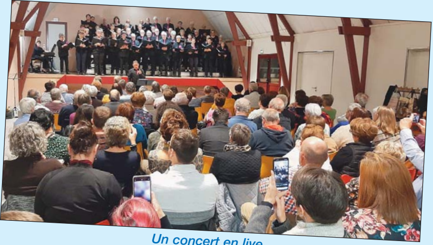
Un concert en live.