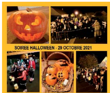
SOIREE HALLOWEEN - 29 OCTOBRE 2021