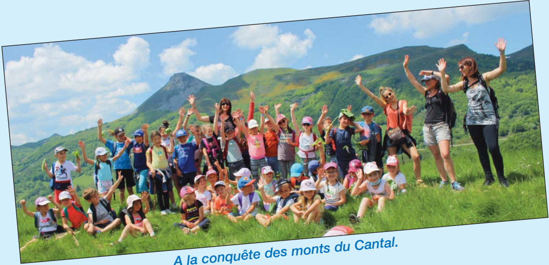
A la conquête des monts du Cantal.