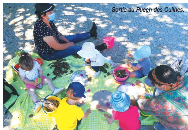
Sortie au Puech des Quilhes.

Alors, bon vent à nos p'tits Lou pour 2022 !