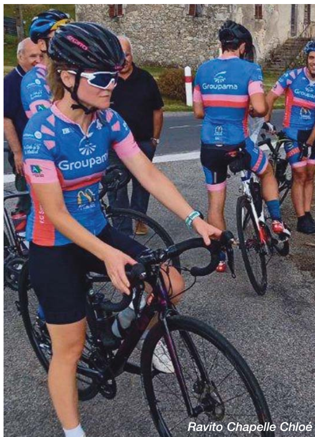
Ravito Chapelle Chloé