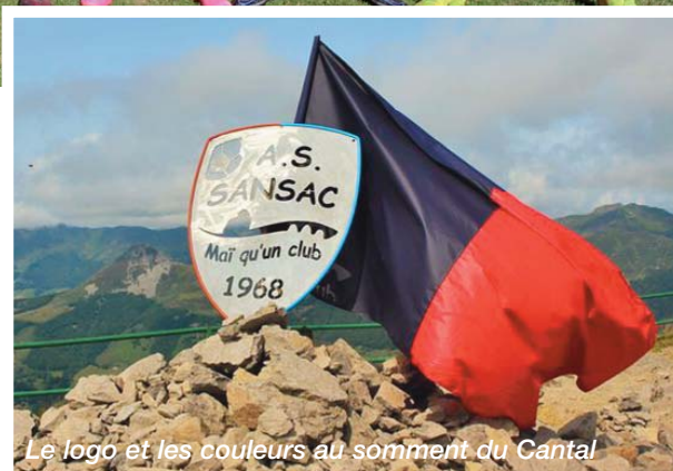
Le logo et les couleurs au sommet du Cantal