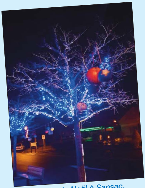
Magie de Noël à Sansac.