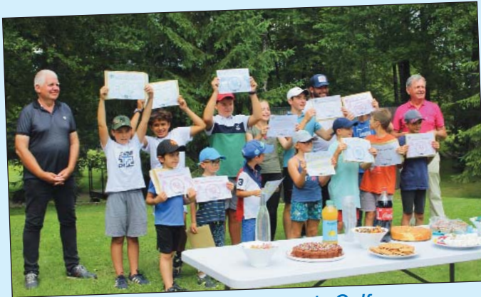
Les futurs champions de Golf...