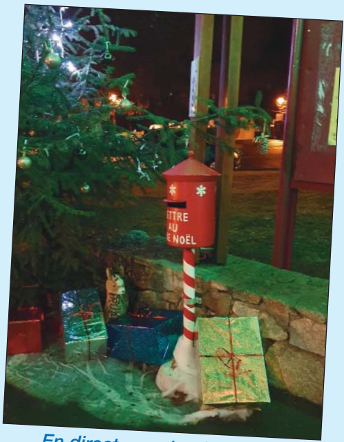
En direct avec le Père Noël.