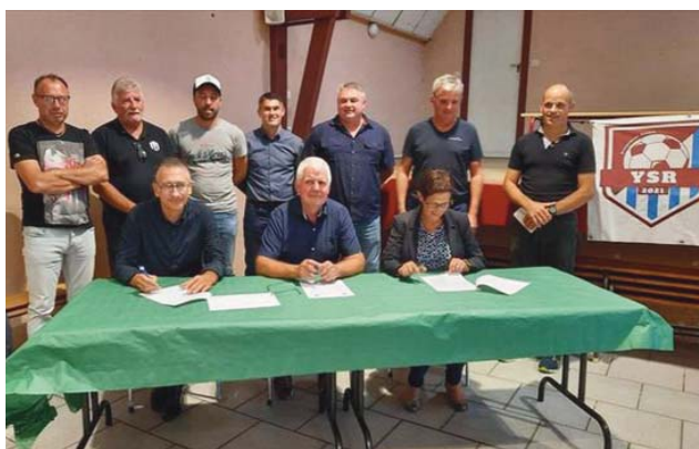
Signature des conventions avec les 3 mairies.

Les premiers résultats et l'assiduité de toutes les catégories aux entraînements laissent penser à un bel avenir pour l'ensemble de nos jeunes licenciés sansacois.