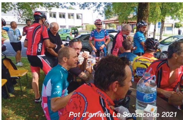
Pot d'arrivée La Sansacoise 2021