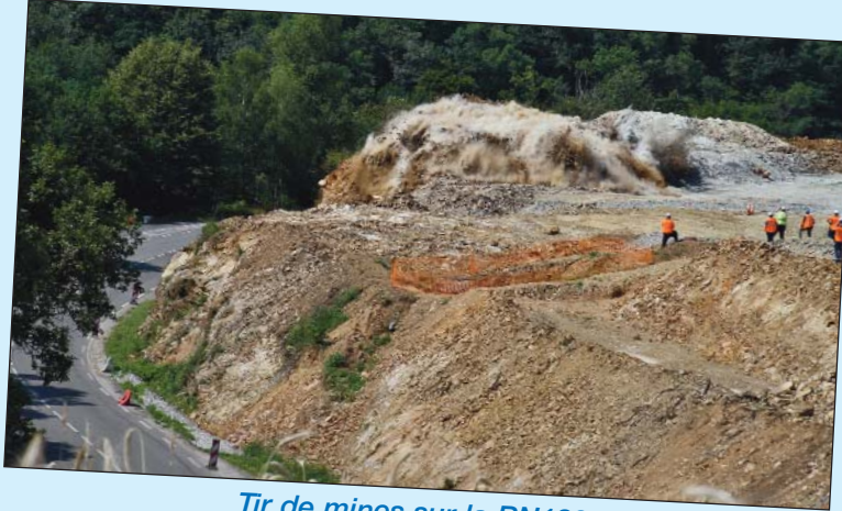
Tir de mines sur la RN122.