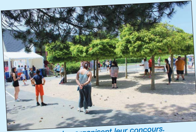
Les ados organisent leur concours.