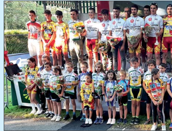
... et les futurs champions cy