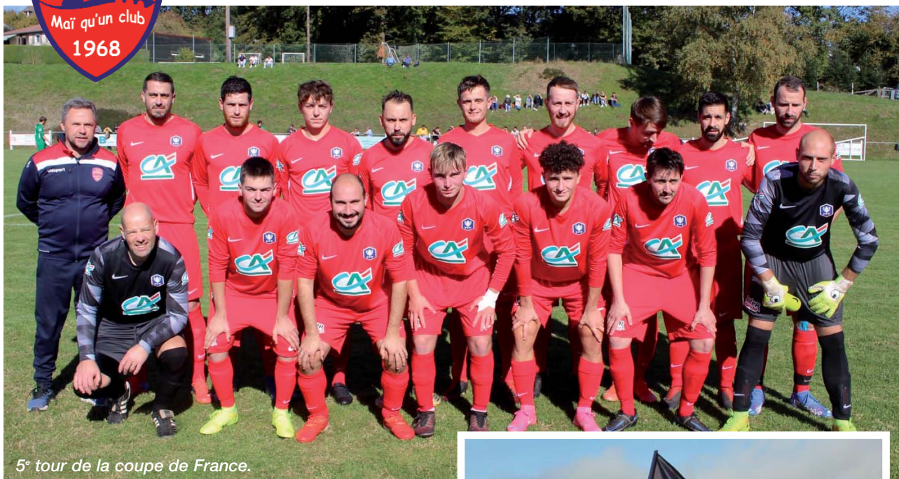
5 e tour de la coupe de France.

Comme pour beaucoup de disciplines sportives, la fin du championnat de football 2020-2021 n'a pas pu aller à son terme. Les classements ont été figés et aucune montée ni descente n'a été programmée. Les 140 licenciés sansacois ont donc dû se résoudre à attendre le mois de juin pour pouvoir reprendre une activité sous forme d'entraînements.