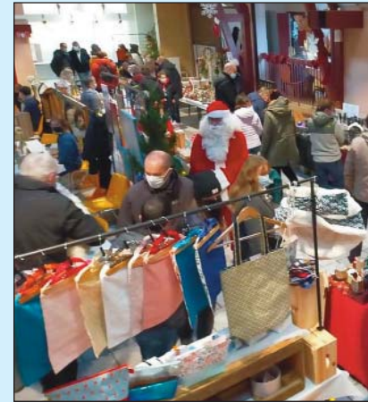
Un marché de N