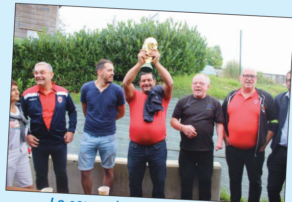
La coupe du monde de football est sansacoise !