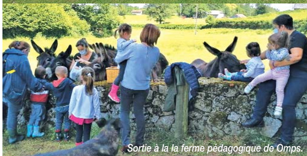
Sortie à la ferme pédagogique de Omps.