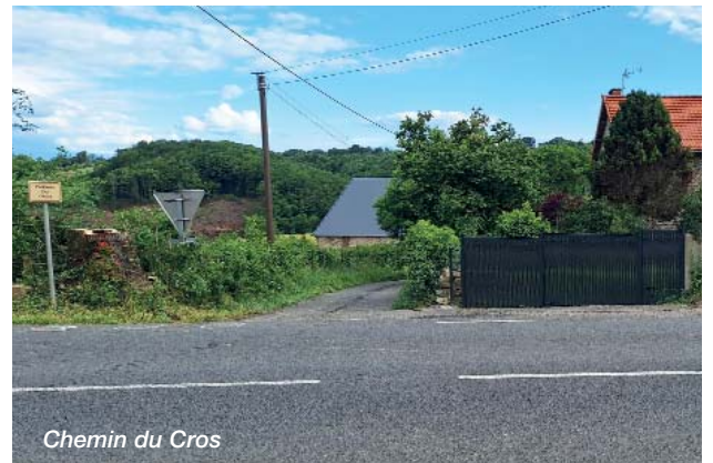
Chemin du Cros

L'élargissement de l'accès au chemin du Cros a aussi été terminé cette année avec la suppression d'un arbre qui cachait la visibilité.