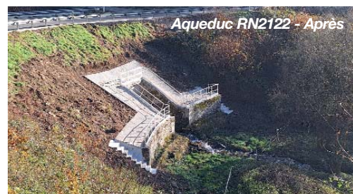
Aqueduc RN2122 - Après