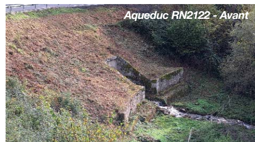
Aqueduc RN2122 - Avant