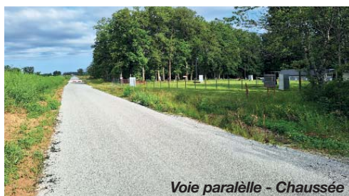
Voie parallèle - Chaussée