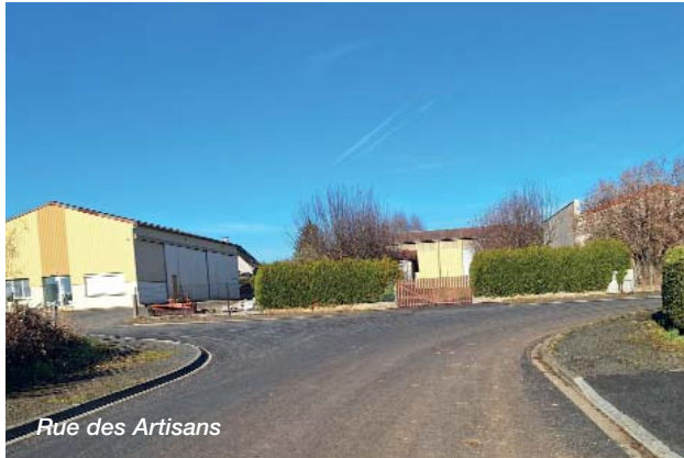
Rue des Artisans

Les travaux de la CABA sur des conduites d'eaux usées rue des Artisans ayant été achevés, la société Colas a effectué une reprise de la chaussée, en grande partie en enrobé, afin de supporter le passage de véhicules d'un certain tonnage.