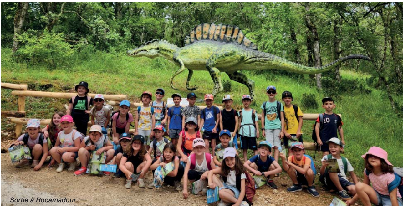
Sortie à Rocamadour.

Les élèves de CP et de CE1 sont allés découvrir le Lot : Le Préhisto-Dino Parc et le rocher des aigles à Rocamadour.