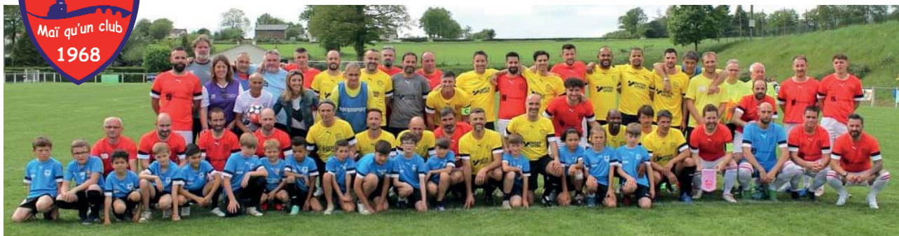
Journée un maillot pour la vie