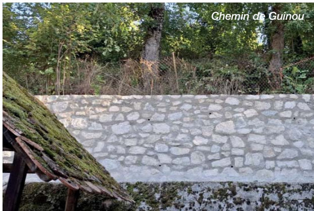
Chemin de Guinou

Le chemin de Guinou commençant à s'affaisser, le mur de soutènement dont les travaux étaient prévus en 2023, a enfin été réalisé, sécurisant ainsi le passage des véhicules.