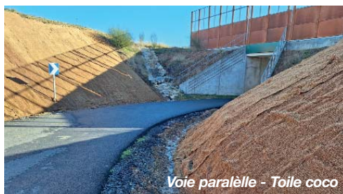
Voie parallèle - Toile coco